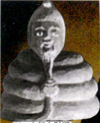
別の宇賀弁財天 から掲載